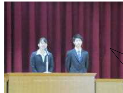
保健体育 3年3組 保健体育 2年2組

また「先生になりたい」という信念をもって教育実習に来られた2人の実習生の紹介がありました。