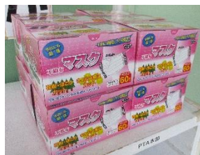
ご寄付いただいたマスク

新型コロナウイルス感染拡大防止対策に様々なご対応、ご協力をいただき、ありがとうございます。今後の予定につきましては、決定次第随時メール等でお知らせしてまいります。急な変更もありますが、どうかご理解を賜りますようお願いいたします。