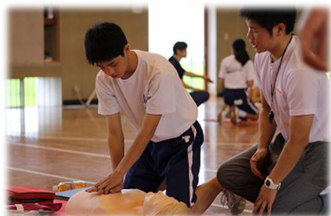
2学年AED講習 (吉川・松伏消防組合の皆様)