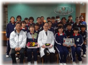
12/4 (月) 福祉の心をはぐむ交流事業

1年生有志生徒が「あすか HOUSE 松伏」様を訪問し、施設内の清掃作業をさせていただきました。本校からは花の球根・肥料を贈呈し、あすか HOUSE 様からは書籍を頂戴しました。