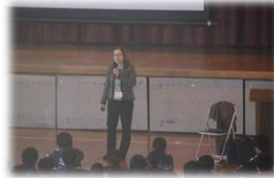
12/11 (月) 子ども安全見守り講座

1年生有志生徒が「あすか HOUSE 松伏」様を訪問し、施設内の清掃作業をさせていただきました。本校からは花の球根・肥料を贈呈し、あすか HOUSE 様からは書籍を頂戴しました。