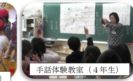
手話体験教室 (4年生)