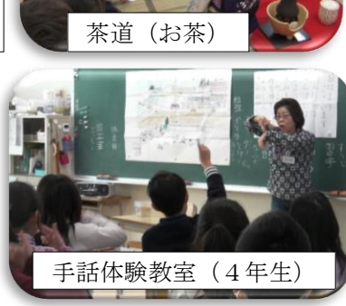
手話体験教室 (4年生)