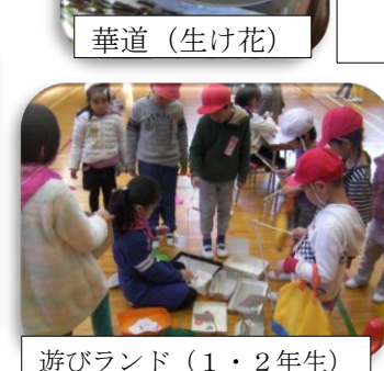
遊びランド (1・2年生)