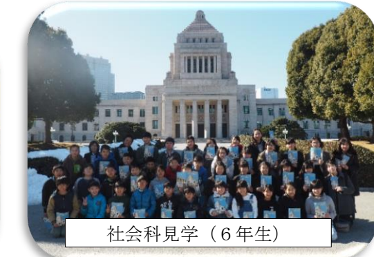
社会科学見学 (6年生)