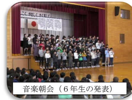
音楽朝会 (6年生の発表)