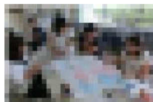
問題を解き、出題傾向や結果を学年ごとに分析しました。