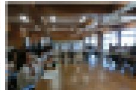
教育課程伝達講習会