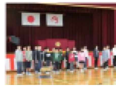
入学式のリハーサル