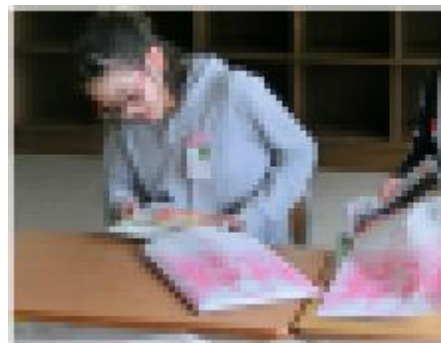
丁寧に教科書を袋詰めします。