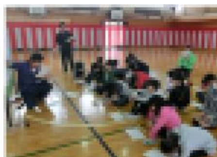
真剣に場所を確認します。