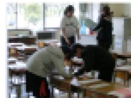
机の名札はりも曲がらないように…