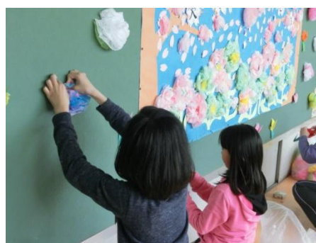
教室掲示で明るい雰囲気…。