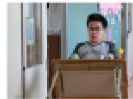
安全に机やいすを移動します。